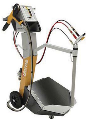
Optiflex Pro B®