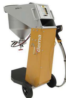
Optiflex Pro S®