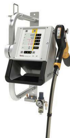
Optiflex Pro W®

O Novo Optiflex Pro B® foi fabricado com uma base em aço inoxidável que previne risco e mantém-se limpa