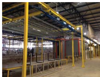
*Linha de pintura a pó