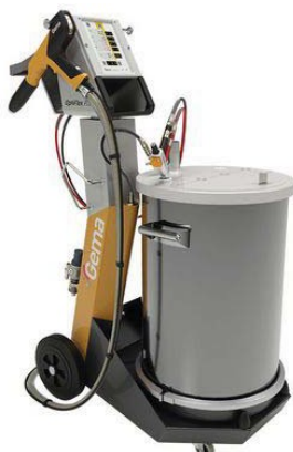
Optiflex Pro F®